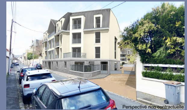
Perspective non contractuelle