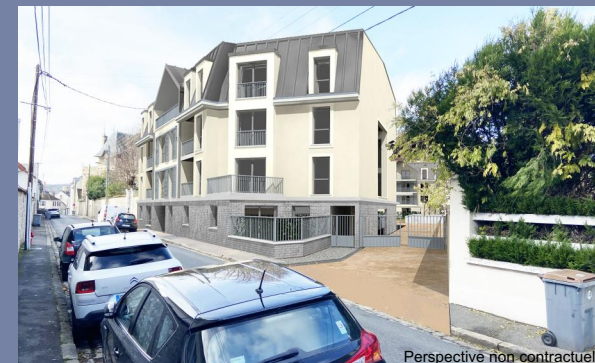
Perspective non contractuelle