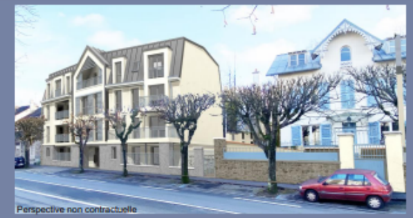
Perspective non contractuelle